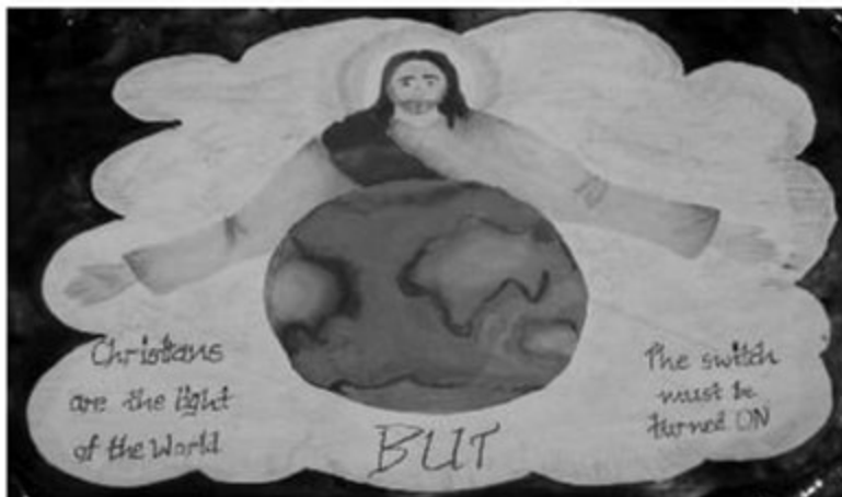
1st prize - Poster competition - Forane Level