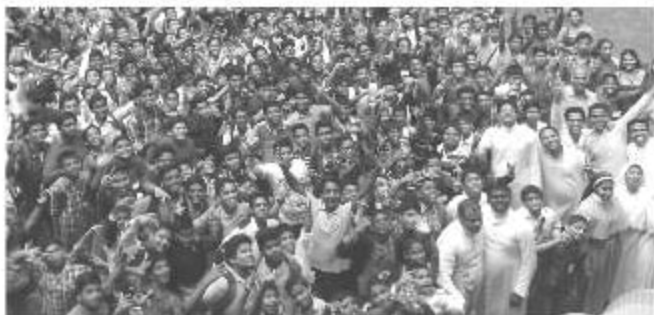
ALTAR BOYS' MEET - ARC PANVEL